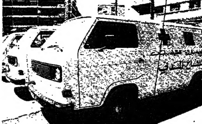
السيارات امام مقر الدفاع المدني